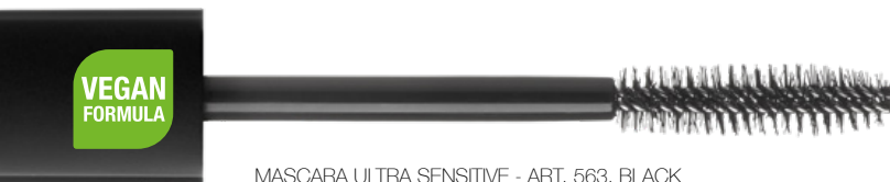
MASCARA ULTRA SENSITIVE - ART. 563, BLACK