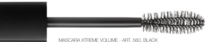
MASCARA XTREME VOLUME - ART. 560, BLACK