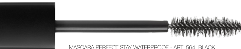
MASCARA PERFECT STAY WATERPROOF - ART. 564, BLACK

ALLE VON STAGECOLOR VERWENDETEN MASCARA-BÜRSTEN SIND OHNE TIERHAARE HERGESTELLT. FÜR VEGANER EMPFEHLEN WIR DIE 100 % VEGANEN FORMULIERUNGEN VON MASCARA HIGH DEFINITION & LENGTH UND MASCARA ULTRA SENSITIVE.