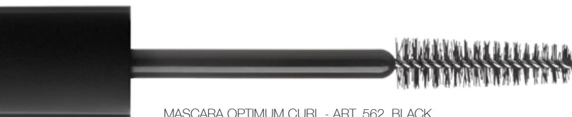
MASCARA OPTIMUM CURL - ART. 562, BLACK