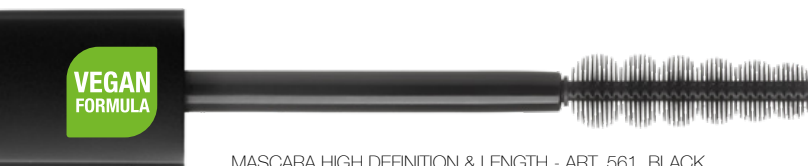
MASCARA HIGH DEFINITION & LENGTH - ART. 561, BLACK